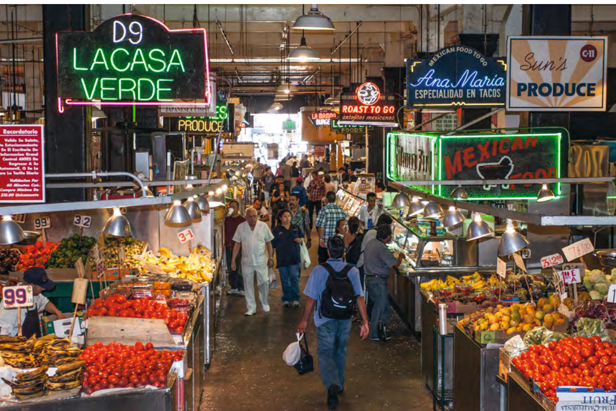
Downtown abrite le foisonnant Grand Central Market , aux influences latines.