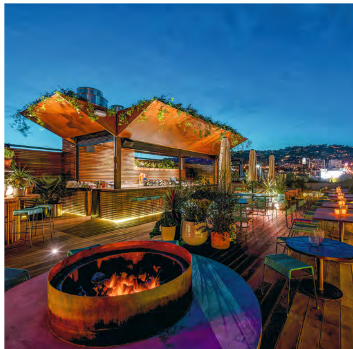
Le rooftop du restaurant E.P. & L.P. permet de prolonger la soirée en contemplant Hollywood.

Schindler House, visite à partir de 6,20 €. www.schindlerhouse.org